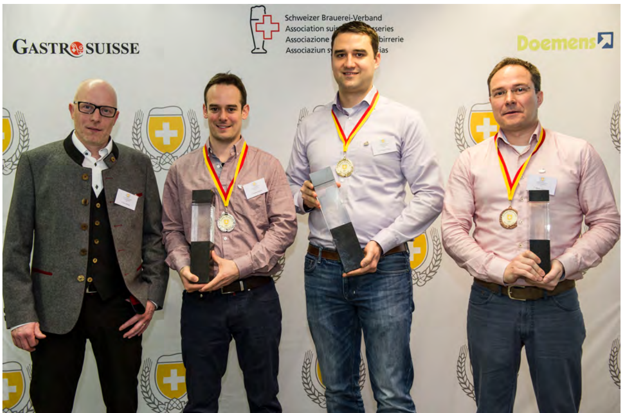
1/1 - Die Schweizer Bier-Sommelier-Nationalmannschaft